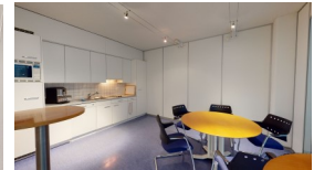
Zur Benützung Cafeteria